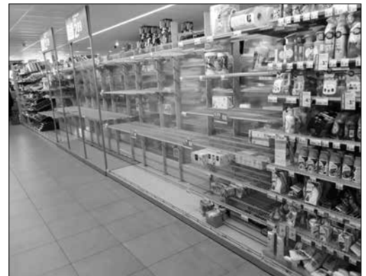
■ Geen toiletpapier!!

Uiteindelijk ging in juli ook de bar weer open. We mochten zelfs weer toernooien laten plaatsvinden. Dat werden er twee. Er was een stevige aanpassing geregeld met looproutes, spatschermen, ruimere belijning en extra terrasmeubilair; aangeschaft voor spotprijzen via marktplaats. We kregen complimenten van de bezoekers voor de organisatie. Kees was streng, maar duidelijk. Dat was ook de bedoeling.