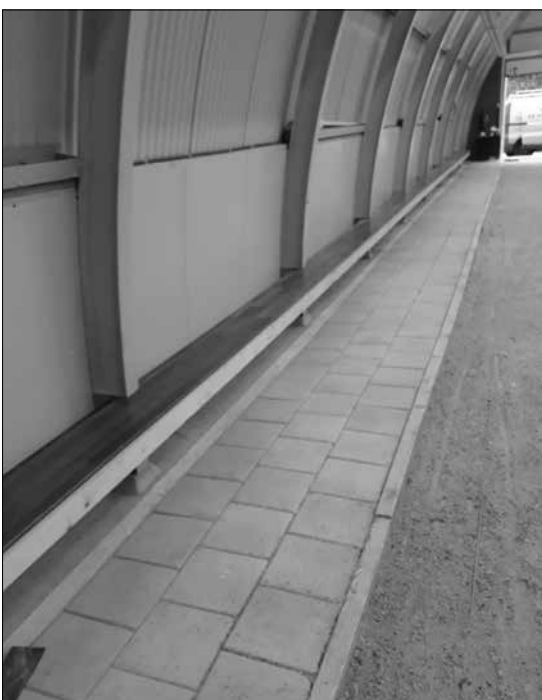
■ Bank in de speelhal voltooid.

We weten het. Na een ogenschijnlijk rustige periode van minder besmettingen werd het opnieuw alarmfase 1. De toernooien vonden geen doorgang, behalve het Plus-Kolkman toernooi. De opgestarte NPC met twee teams werd stilgelegd en nu, terwijl dit geschreven wordt, ligt alles nog stil.