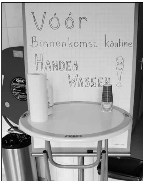
■ Handen wassen.

Coronamail, 1½ meter, Astrareneta, Carbidschieten, Carola, Corona, Corona-angst, Coronaboete, Moderna, Coronaboulen, Coronacrisis, Melkbussenhandel, Coronadiscussies, Coronamoeheid, Coronaoverschot, Oxford vaccin, Corona-uitbraak, Coronavaccin, Coronaverschijnselen, Coronawaanzin, Covid-19, Femke, Reservatol, Filearmoede, Gommers, Impact, Instagram, Trump, Leegte, Likes, Mondkapje, Persco, Persconferentie, Persmo, Pfizer, Prikweigeren, Regels, Reukverlies, Sluiting, Spatschermen, Sportprotocol, Spuugkappen, Thuiswerken, Vaccin, Verbod, Doventolk, Verboden, Virusdeskundige, Viruswaanzin,