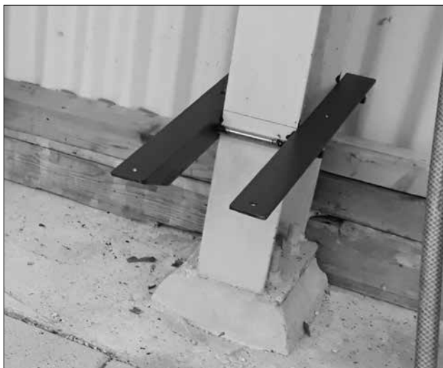
■ Drager bank.