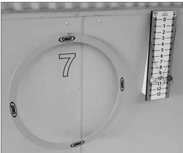
■ Nieuwe (gele) ringen en telborden in de speelhal.