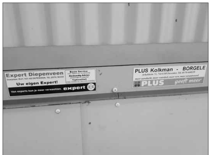
■ Bordjes van onze halsponsors.