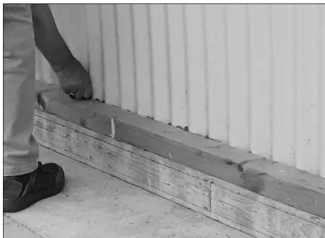
■ Tochtgaten dicht gemaakt.